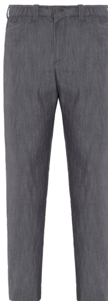
J019 Jeans grigio