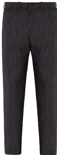
J000 Jeans nero